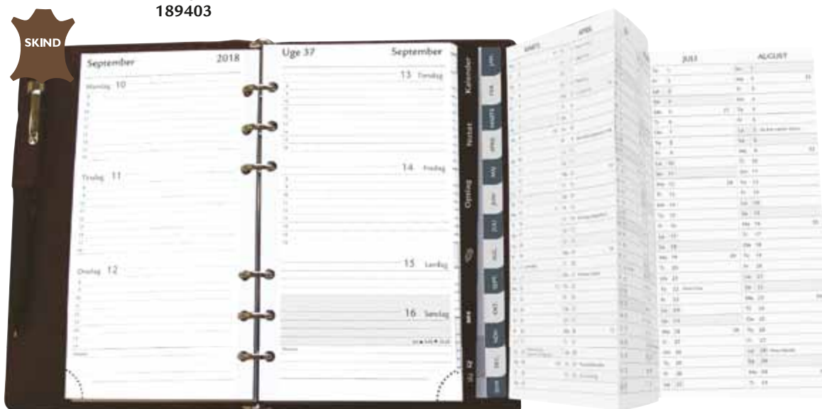
Model C Komplet · Sort skind 189403

Omslag i sort eller bordeaux skind, samt i kunstlæder og sort vinyl.