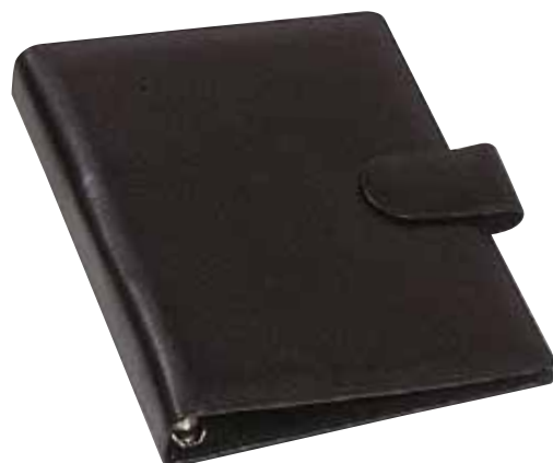
Løst sort kunstlæderomslag 189229

Formater og hulafstande passer til andre typer systemer.