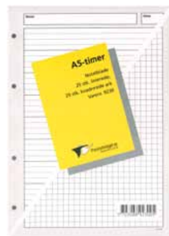
Notatblade 25 stk. linierede og 25 stk. kvadrerede: 189230