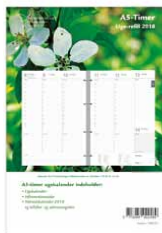
Uge-refill 189225 Format: 14,8 x 21 cm