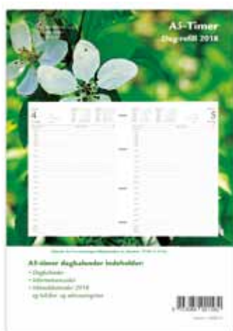
Dag-refill 189215 Format: 14,8 x 21 cm